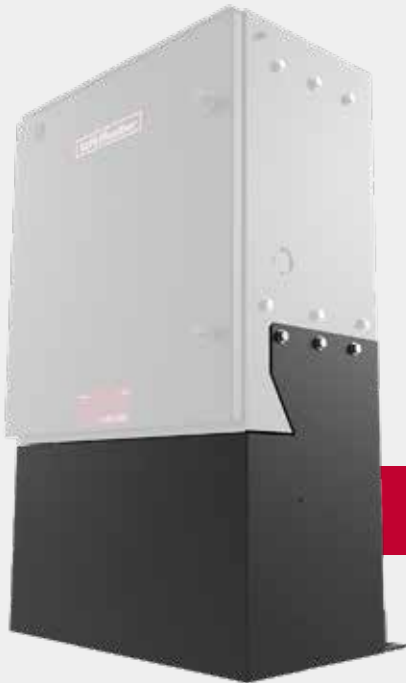
Montaje del elevador MRIN

Nuestros nuevos operadores de compuerta deslizante industriales de alta resistencia tienen el mismo tamaño de instalación que la popular SL595 y el SL585 con el accesorio MRIN. Esto crea una instalación eficiente que ahorra tiempo y dinero a los clientes. El proceso de instalación, que se lleva a cabo con los estándares de UL 325, requiere cambios limitados en la ubicación o el servicio eléctrico; simplemente reemplace una unidad por la otra.